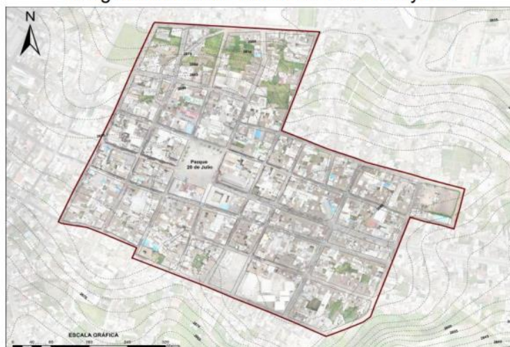
Imagen 30 Área de Intervención del Proyecto